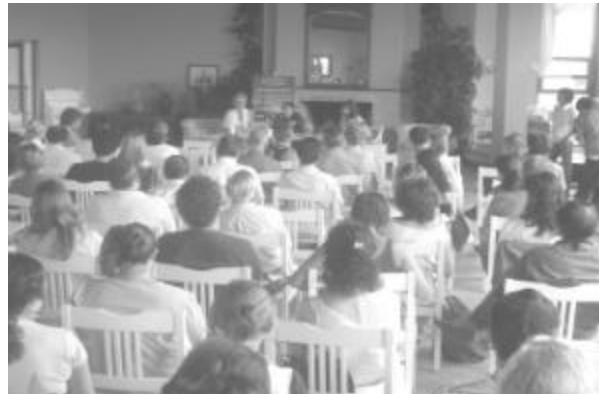
Foro Desarrollo Sustentable del Área de José Ignacio - marzo de 2005

Los Foros Participativos contribuyen a un nuevo modelo de toma de decisiones y a una cultura política diferente, en la cual la voz de la ciudadanía es tomada en cuenta por las autoridades. Las propuestas surgidas de los Foros constituyen un importante insumo para el diseño de las políticas públicas.